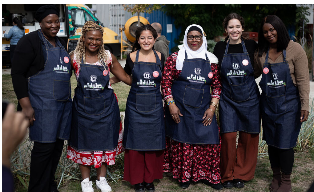
Les candidates de la catégorie « Recette de Famille » lors de la finale de la première édition du Championnat du Monde des Cuisines du Monde made in 93, organisée à Zone Sensible