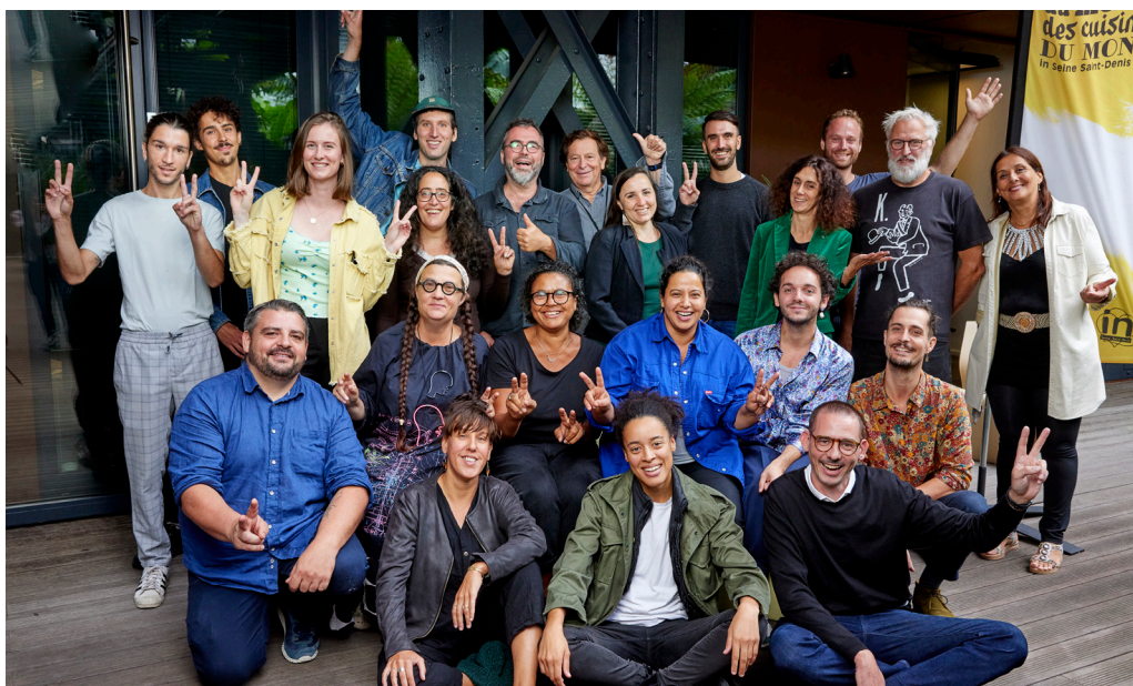
Les candidat.e.s et les juré.e.s de la catégorie « Cuisine et Création » lors de la demi-finale de la première édition du Championnat du Monde des Cuisines du Monde made in 93, organisée à la Manufacture Design de Saint-Ouen